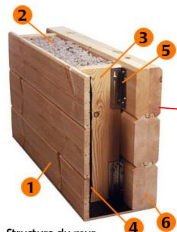
Structure du mur avec isolation intérieure supplémentaire